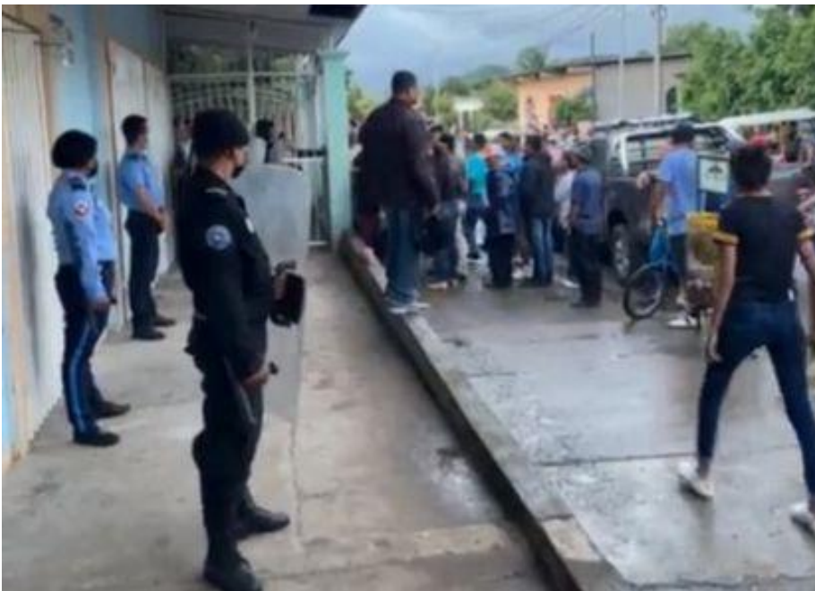
Efectivos Policiales durante operativo contra iglesia católica en Sébaco.

Las emisoras cerradas son radio Hermanos, del municipio de Matagalpa; radio Nuestra Señora de Lourdes de La Dalia; radio Santa Lucía, de Ciudad Darío; radio Católica de Sébaco; radio Nuestra Señora de Fátima de Rancho Grande; radio San José de Matiguás y radio Monte Carmelo de Río Blanco.