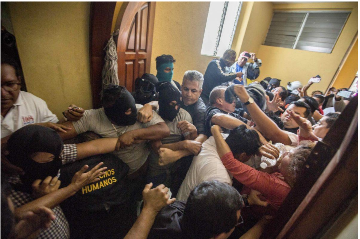
Fuerzas de choque o paramilitares profanan y agreden a líderes religiosos de la Conferencia Episcopal de Nicaragua en la parroquia de Diriamba en Julio de 2018.

El régimen Ortega Murillo pretende debilitar el posicionamiento y la crítica política de los líderes de la iglesia católica, quienes, desde la crisis del 2018, se han comprometido fuertemente para denunciar las actuaciones del régimen en contra de la sociedad nicaragüense. Este tipo de acciones ocurridas en Sébaco son demostraciones de dominio y pretensiones de control absoluto por parte del régimen, para enviar un mensaje amenazador, de que cualquier espacio o estructura de incidencia que tenga la Iglesia será desmontada por la fuerza.